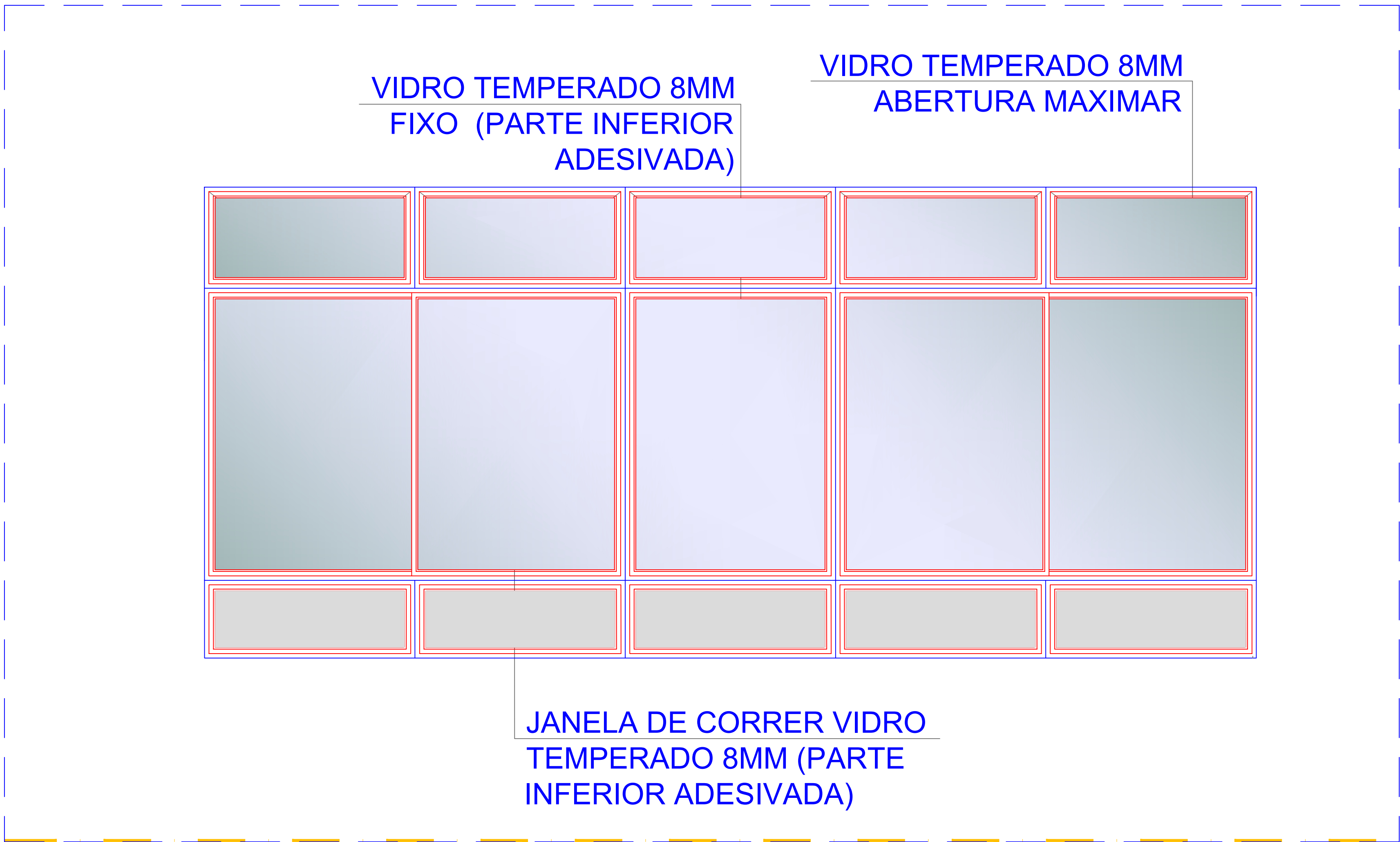
Modelo das esquadrias item 4.1 da planilha